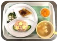
6月の誕生会 (あじさいごはん)

◎各月のお誕生会では、少し特別なお楽しみメニューをその月にあった可愛い盛り付けで提供します。