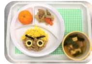
2月の誕生会 (おにごはん)