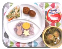
9月の誕生会 (十五夜ごはん)