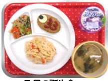
5月の誕生会 (こいのぼりハンバーグ)

◎各月のお誕生会では、少し特別なお楽しみメニューをその月にあった可愛らしい盛り付けで提供します。